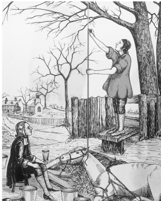
Rysunek 1. Pierwszy bezpośredni pomiar ciśnienia tętniczego krwi.

Ciśnienie skurczowe i rozkurczowe może być mierzone przez wprowadzenie małego cewnika do tętnicy i podłączenia go do wskaźnika ciśnienia. Ten sposób bezpośredniego pomiaru może być dokładny, jednak jest inwazyjny i często niewygodny, a także niepraktyczny. Metoda ta była w istocie sposobem pierwszego pomiaru ciśnienia krwi, dokonanego przez wielkiego Stephena Hales'a w 1714 w tętnicy konia (Rysunek 1). Prosty pomiar ciśnienia krwi może być przeprowadzony z akceptowalną dokładnością przy użyciu nieinwazyjnych metod pośrednich.